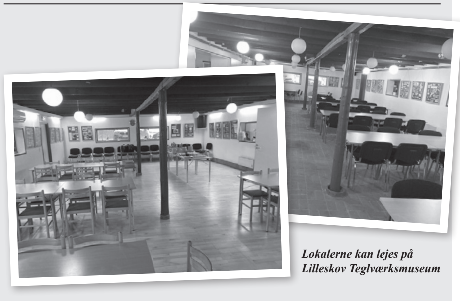
Lokalerne kan lejes på Lilleskov Teglværksmuseum